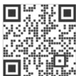
Film aziendale del TAF